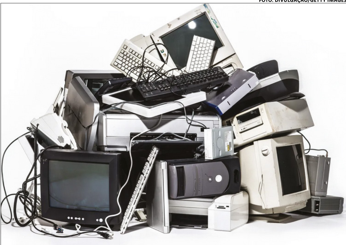
O evento possibilitará o desmonte e a reciclagem dos dispositivos recolhidos

lares, notebooks, baterias de notebooks, chapas de raio X, cabos de força, cabos carregadores, adaptadores e qualquer outro tipo de equipamento eletrônico. A coleta desses dispositivos ocorrerá nos seguintes locais e datas, no horário das 10h às 16h: 18 de setembro: Jardim América - Escola Municipal Domingos Simão de Oliveira 19 de setembro: Jardim Brasília - CEMEI 20 de setembro: Jardim Pérola - Praça da Pérola 21 de setembro: Prefeitura - Pátio 22 de setembro: Santa Lúcia - Praça do Santa Lúcia Além da ação de recolhimento de eletrônicos, o evento também oferecerá atividades complementares, como pintura de rosto, cortes de cabelo e um pula-pula para entretenimento das crianças presentes.