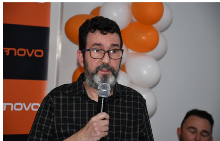
Adriano Sarmento: direção