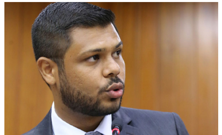
Romário Policarpo, presidente da Câmara Municipal de Goiânia