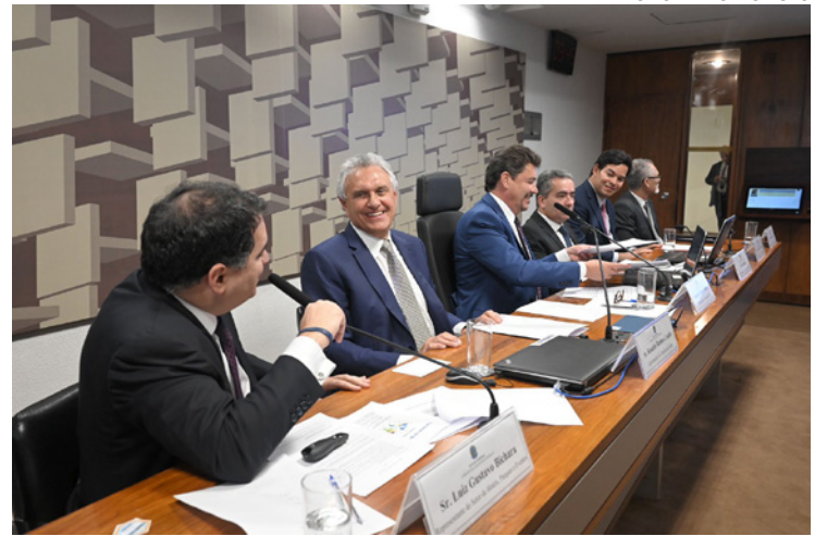
Governador Ronaldo Caiado em audiência pública no Senado Federal: alerta para prejuízos de estados

“O modelo que queremos não pode ser pensado como um Cavalo de Tróia, que traga embutido aumento de carga e em determinado ponto uma limitação dos entes federativos conforme trazido pelo Caiado”, considerou o senador Efraim Moraes Filho (PB). “Sou contra a reforma tributária, não tenho dúvida em falar isso”, destacou o senador