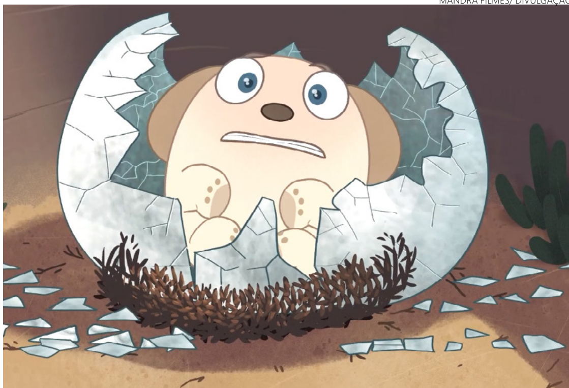
Resiliente: personagem de filme goiano luta para descobrir passagem secreta

Esse é o primeiro trabalho cinematográfico que exige fôlego realizado pela produtora goiana Mandra Filmes. Para