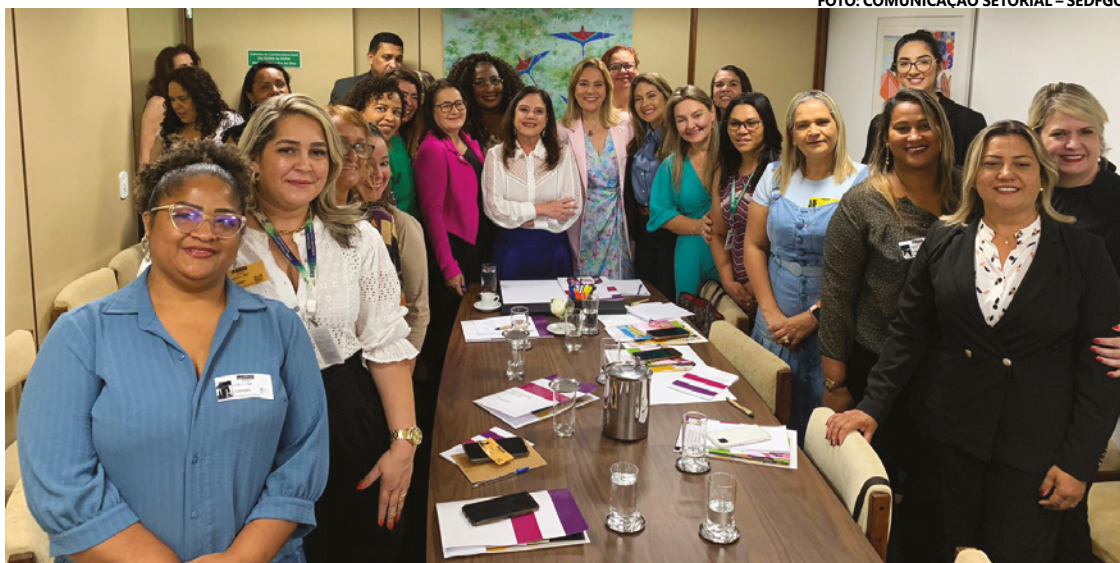
Representantes de associações de mulheres e vereadoras foram recebidas na Procuradoria da Mulher da Câmara Federal

O objetivo do grupo é buscar apoio para que as Câmaras Municipais do Entorno criem as respectivas procuradorias da mulher