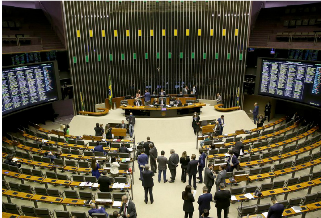
Plenário da Câmara dos Deputados: reação à desapropriação de terras produtivas

O objetivo do projeto, dizem os deputados, é garantir que terras produtivas – isto é, já utilizadas para agricultura e pecuária – não sejam desapropriadas pelo governo para a reforma agrária. Em caso de desapropriação, o governo paga