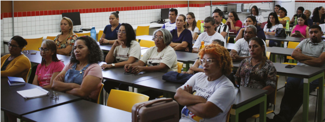
Durante o treinamento, foram discutidos procedimentos para lidar com situações em que as informações de vacinação possam não ter sido enviadas corretamente para o Ministério da Saúde