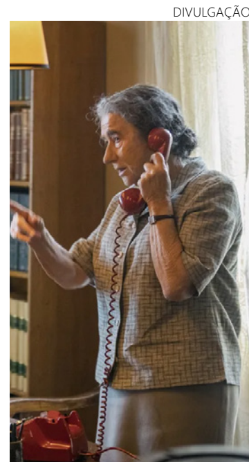
Dama de ferro: Helen Mirren interpreta política importante da história de Israel

“Golda - A Mulher de uma Nação” é um bom e adulto filme político. Mas, como, político? Não se trata da Guerra do Yom Kippur? Sim, mas como dizia Clausewitz, a guerra é a continuação da política por outros meios.