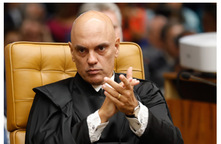
Alexandre de Moraes: materialidade do crime ficou comprovada

Moraes defendeu que a materialidade do crime ficou provada. “O réu foi preso em