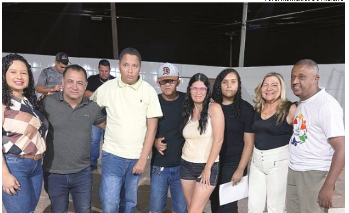
Registro do evento beneficente promovido pela APAE Novo Gama em colaboração com a CDL.

Tudo o que é cultivado nessas hortas é utilizado como fonte de alimentação, e os alunos são instruídos sobre o cultivo sustentável e o consumo de alimentos saudáveis, promovendo assim uma educação integral.