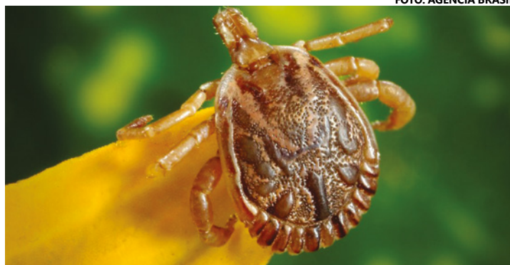
A febre maculosa é causada pela picada de carrapatos com a bactéria Rickettsia rickettsii

No Brasil, os principais vetores são os carrapatos do gênero Amblyomma , tais como A. sculptum , conhecido como carrapato estrela; A. aureolatum e A. ova-